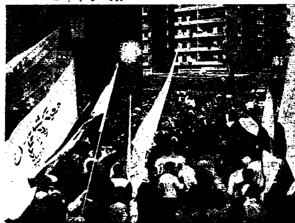
الرئيسان الجميل وكرامي وسط الجماهير المحتشمة